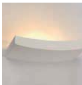
GL 102 CURVE Gipswandleuchte